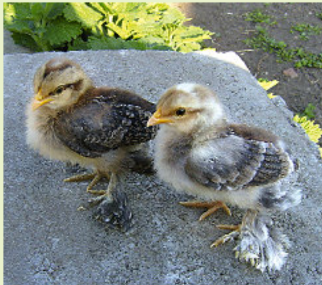
Rund 10 Tage alte Küken kennfarbiger Federfüßiger Zwerghühner, rechts der Hahn